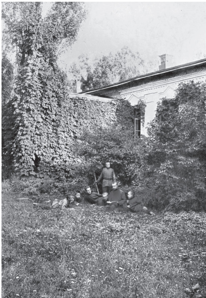
Группа воспитанников у входа в Воздвиженскую школу