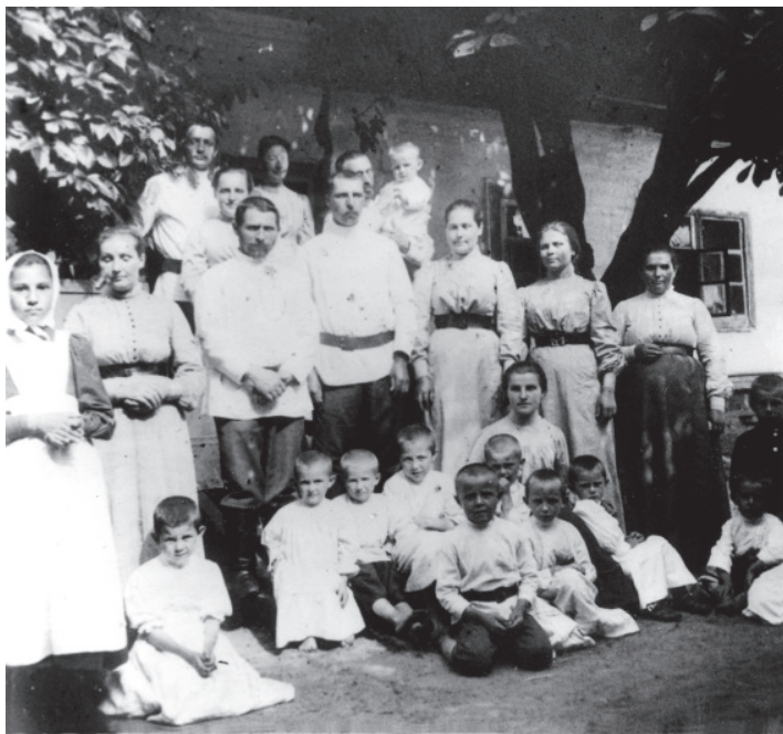
Братская семья Крестовоздвиженского православного трудового братства во время отдыха. Село Воздвиженское Черниговской губернии. 1890-е гг.

ведников веры, живших в первой половине XX века, практически забыто. Советский период стал временем разрыва традиции, отказа от преемственных связей с жизнью до-революционной России. Многие люди стали «лишними», «пережитком прошлого» и «классовыми врагами», от которых безбожная власть нещадно избавлялась. Молчаливый страх, сопровождавший репрессии, завершил дело: память о многих людях была уничтожена. Но у Бога «все живы» (Лк 20:38); Он возвращает забытые имена Своих святых Церкви. Надеемся, что предлагаемое читателю издание станет вкладом в дело восстановления памяти обо